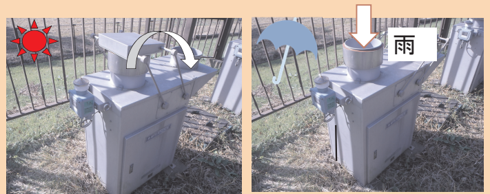
自動降水捕集装置(小笠原計器製US-330)